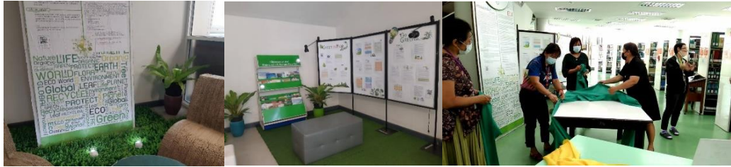
ภาพที่ 11 ภาพการจัดนิทรรศการส่งเสริมการเรียนรู้ด้านการอนุรักษ์พลังงานและรักษาสิ่งแวดล้อม