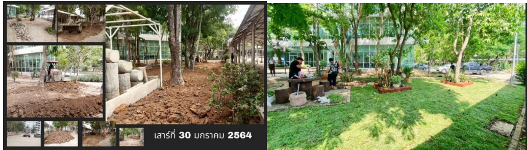
ภาพที่ 9 ภาพการจัดสภาพแวดล้อมเพื่อเพิ่มพื้นที่สีเขียว