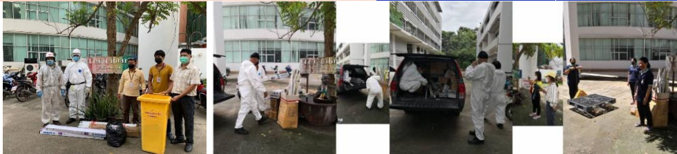
ภาพที่ 8 ภาพการกำจัดขยะอันตรายส่งกำจัดอย่างถูกวิธี