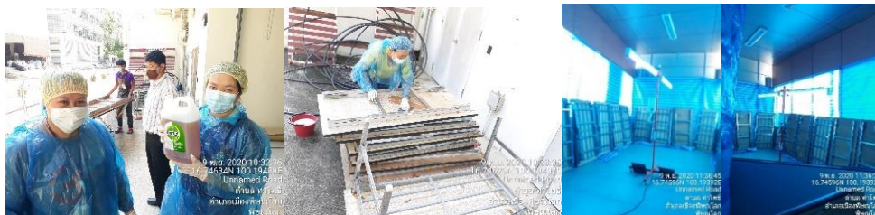
ภาพที่ 5 ภาพการกำจัดเชื้อราโต๊ะพับขาว

5.1 การกำจัดเชื้อราที่พบในสถานที่ทำงาน “การกำจัดเชื้อราโต๊ะพับขาว ด้วยการพ่นหมอกน้ำยาเดทตอลและ การติดตั้งหลอดรังสี UV-C เพื่อฆ่าเชื้อราและแบคทีเรีย”