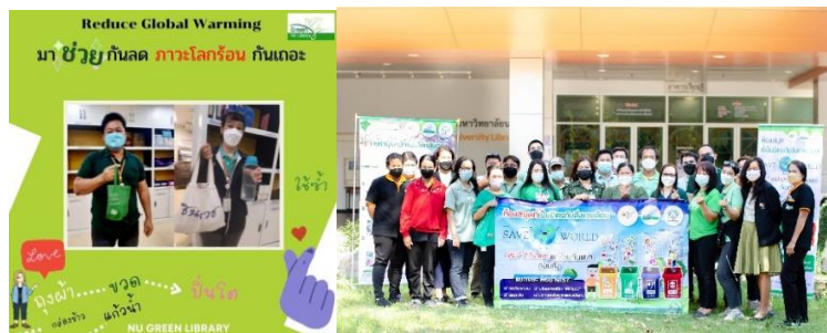
ภาพที่ 7 ภาพการรณรงค์การลดภาวะโลกร้อน

5.4 การรณรงค์การลดภาวะโลกร้อน ดำเนินการจัดการขยะ โดยเลือกวิธีการที่เหมาะสม ลดปริมาณขยะ (Reduce) การใช้ซ้ำ (Reuse) การนำกลับมาใช้ใหม่ (Recycle) ความถูกต้องของการคัดแยกขยะ