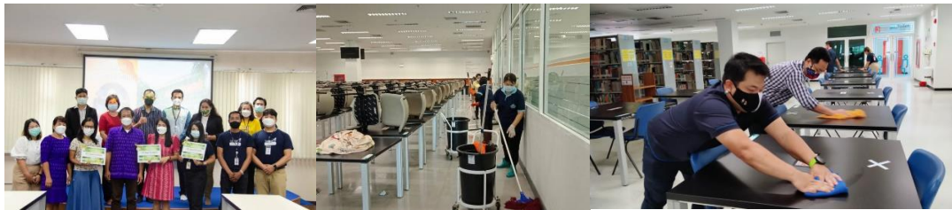
ภาพที่ 10 ภาพกิจกรรม 5ส และทำความสะอาดตามมาตรการป้องกันการแพร่ระบาดของเชื้อไวรัสโคโรน่า 2019