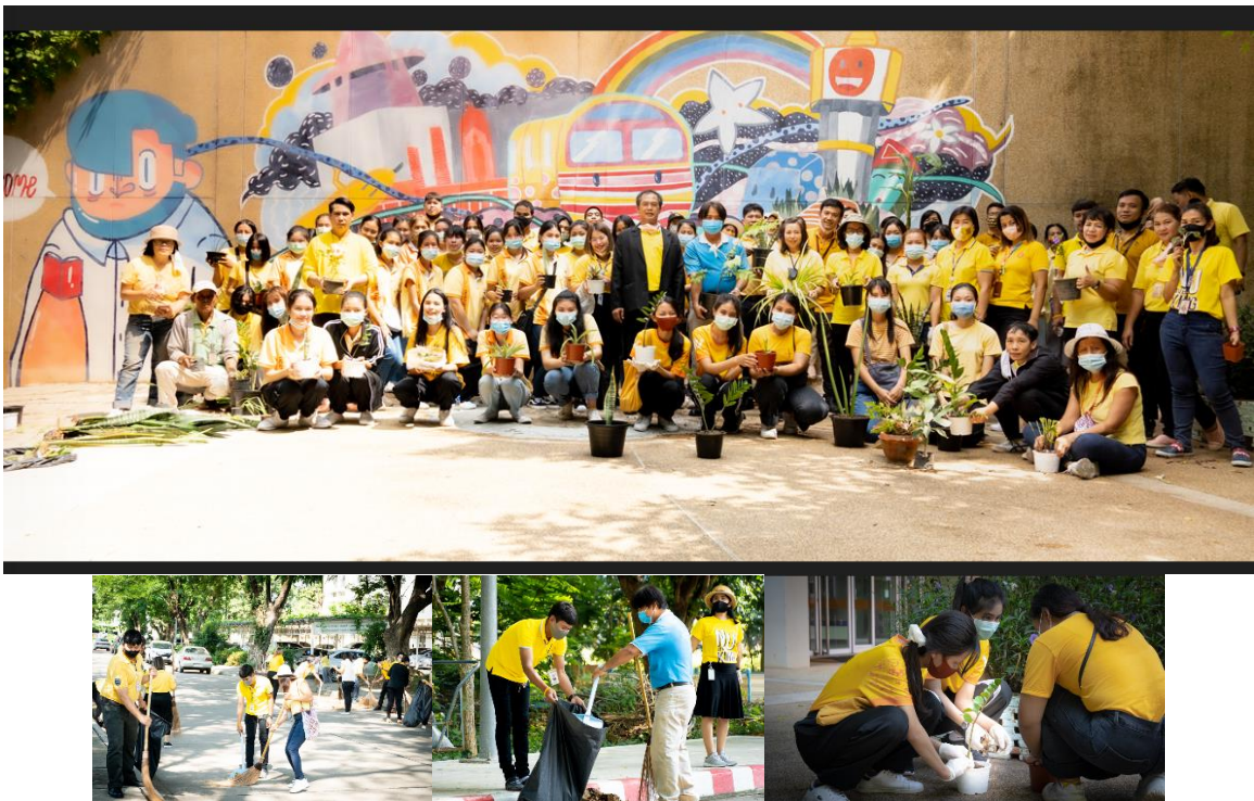
ภาพที่ 12 ภาพกิจกรรมเก็บกวาดพื้นที่สาธารณะ และปลูกต้นไม้