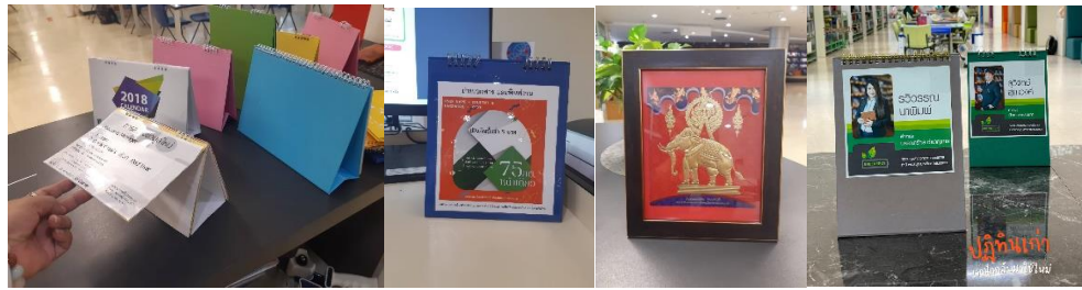
ภาพที่ 6 รณรงค์การลดการใช้ทรัพยากร (ปฏิทินเก่า)

5.2 สำนักหอสมุดร่วมเป็นสื่อกลางให้หนังสือและบุคคลทั่วไปทราบถึงแหล่งรับบริจาคปฏิทินเก่า และเพื่อรณรงค์การลดการใช้ทรัพยากร (ปฏิทินเก่า) ไม่ทิ้งไป หรือใช้ให้เกิดประโยชน์สูงสุด โดยไม่กระทบต่อสิ่งแวดล้อม การรณรงค์ลดการใช้ทรัพยากร