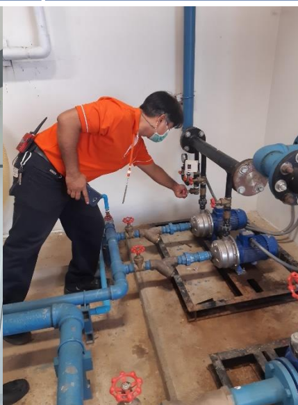
ภาพระบบสูบน้ำ Recycle ที่นำน้ำกลับมาใช้รดน้ำต้นไม้ ของอาคารเรียนรัฐ