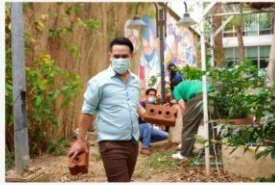
02 ภาพผู้เข้าร่วมกิจกรรม