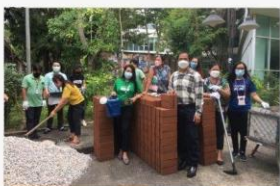
01 กิจกรรมปรับภูมิทัศน์ให้สวยงาม 2 ก.พ. 65