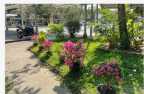
08 กิจกรรมปรับภูมิทัศน์ให้สวยงาม