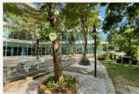
05 กิจกรรมปรับภูมิทัศน์ให้สวยงาม