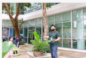
01 กิจกรรมปรับภูมิทัศน์ให้สวยงาม