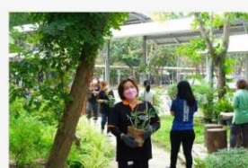
08 ภาพผู้เข้าร่วมกิจกรรม