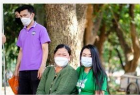
03 ภาพผู้เข้าร่วมกิจกรรม