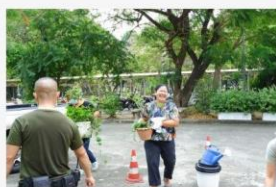
04 ภาพผู้เข้าร่วมกิจกรรม