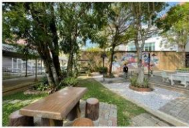
03 กิจกรรมปรับภูมิทัศน์ให้สวยงาม