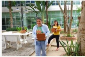
05 ภาพผู้เข้าร่วมกิจกรรม