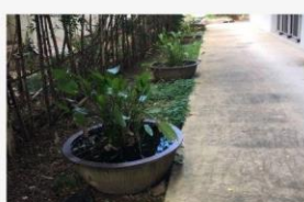
07 ภาพกิจกรรม