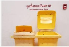
01 กำหนดจุดทิ้งขยะอันตราย