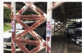
06 ภาพกิจกรรม