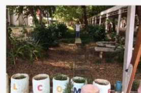
06 ภาพกิจกรรม