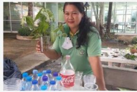
01 3 พ.ย. 64