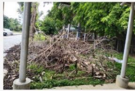
01 6-7 ต.ค. 64 ตัดกิ่งไม้สูง เก็บกิ่งไม้ ไหลวน