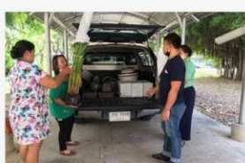
07 ภาพกิจกรรม