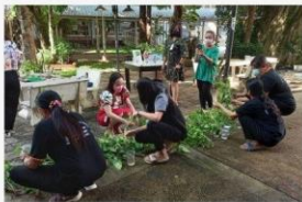
03 ภาพกิจกรรม