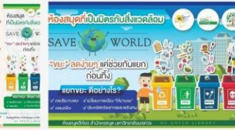
03 สื่อ ปชส. การแยกขยะขั้น 4 และ จุดทิ้งขยะ