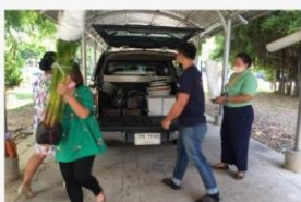
01 จัดซื้อวัสดุเพื่อปรับภูมิทัศน์ 19-20 ม.ค. 65