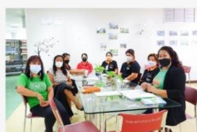
07 ประชุมการจัดการขยะ และการงานแม่บ้าน