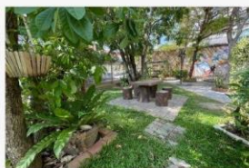
07 กิจกรรมปรับภูมิทัศน์ให้สวยงาม