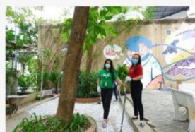
05 ภาพผู้เข้าร่วมกิจกรรม