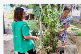
06 ภาพกิจกรรม