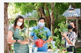
06 ภาพกิจกรรม