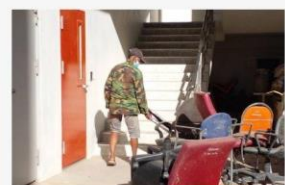
08 5ส ใต้บันได 20 พ.ย. 64