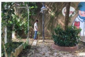
01 วางแผนและสำรวจก่อนปรับภูมิทัศน์ 3 พ.ย. 64