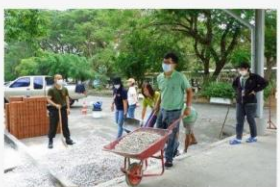
03 ภาพผู้เข้าร่วมกิจกรรม