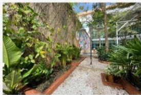
02 กิจกรรมปรับภูมิทัศน์ให้สวยงาม