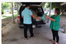
02 ภาพกิจกรรม