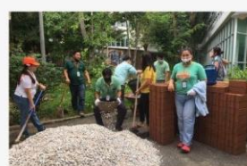
08 ภาพผู้เข้าร่วมกิจกรรม