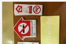
07 ภาพกิจกรรม