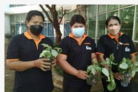
07 ภาพกิจกรรม