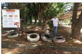
03 ภาพผู้เข้าร่วมกิจกรรม