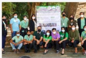
04 ภาพรณรงค์การนำขยะแบบไม่กลับ กอง