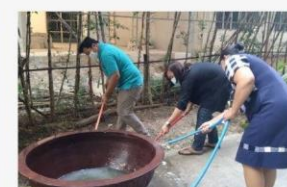
08 บรมภูมิทัศน์ช่างหลังอาคาร ย้าย-ล้าง