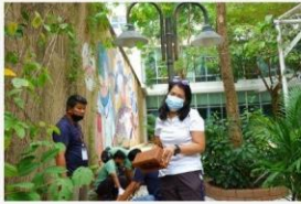
01 กิจกรรมปรับภูมิทัศน์ให้สวยงาม