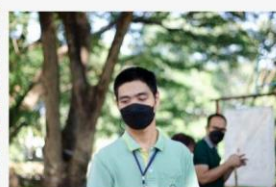
07 ภาพผู้เข้าร่วมกิจกรรม