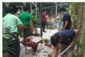
05 ภาพกิจกรรม