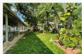
06 กิจกรรมปรับภูมิทัศน์ให้สวยงาม