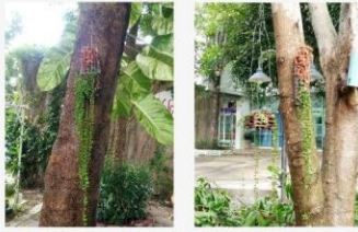
ประธานสิ่งแวดล้อมตรวจสอบดูสภาพต้นไม้