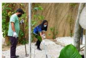
02 ภาพผู้เข้าร่วมกิจกรรม