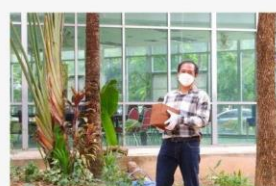
06 ภาพกิจกรรม