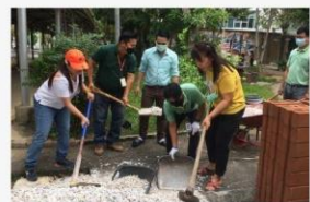
08 ภาพผู้เข้าร่วมกิจกรรม