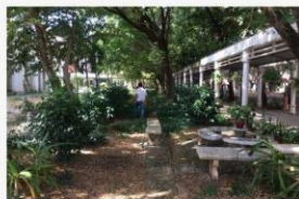
02 ประสานและรองประสานด้านสิ่งแวดล้อม สำรวจและวางแผน