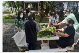
05 ภาพกิจกรรม