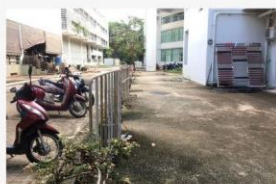
04 ภาพกิจกรรม