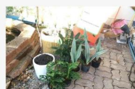
08 ภาพกิจกรรม