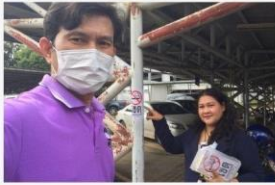
01 การจัดการบิณฑบาตพิฆทางอากาศ