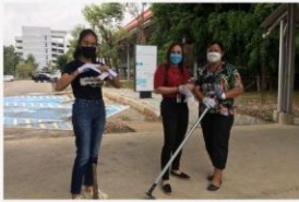
03 ภาพผู้เข้าร่วมกิจกรรม