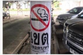
05 ภาพกิจกรรม