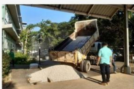
03 ภาพผู้เข้าร่วมกิจกรรม