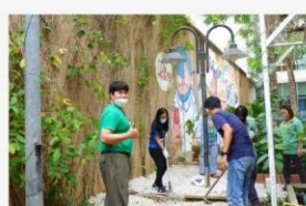
07 ภาพผู้เข้าร่วมกิจกรรม