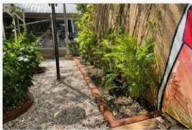
01 กิจกรรมปรับภูมิทัศน์ให้สวยงาม