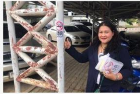
02 ภาพผู้เข้าร่วมกิจกรรม