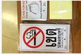
04 ภาพกิจกรรม