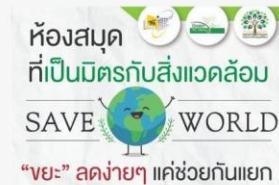
04 สื่อ ปชส. การแยกขยะ