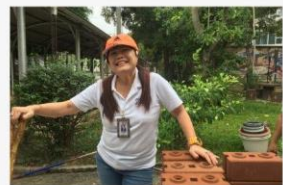
06 ภาพผู้เข้าร่วมกิจกรรม