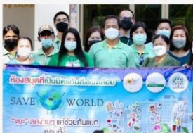
01 รณรงค์การจัดการขยะอย่างถูก วิธี 1 ธ.ค. 64