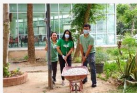
07 ภาพผู้เข้าร่วมกิจกรรม