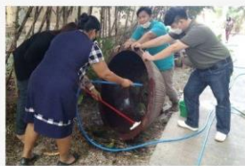
04 สำแพน นาคำไท