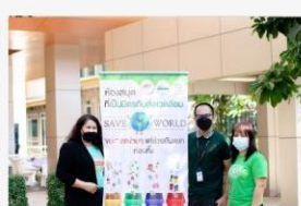
05 ภาพกิจกรรม