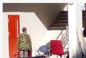
07 5ส ใต้บันได 20 พ.ย. 64