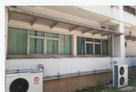
08 12 ก.พ. 65 ทำความสะอาดหลังห้องวิเคราะห์