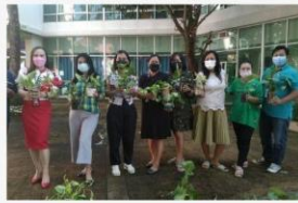
02 กิจกรรมรณรงค์อนุรักษ์สิ่งแวดล้อม มาทำแจกัน ต้นไม้