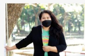
08 ภาพผู้เข้าร่วมกิจกรรม