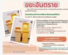
02 ปชส. ต่อยุคกลาง