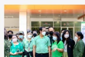
06 ภาพกิจกรรม