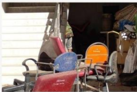
01 5ส ใต้บันได 20 พ.ย. 64