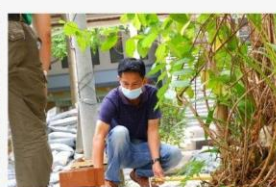
07 ภาพผู้เข้าร่วมกิจกรรม