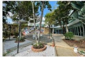
04 กิจกรรมปรับภูมิทัศน์ให้สวยงาม