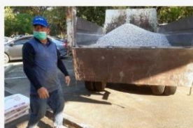
04 ภาพกิจกรรม