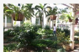
08 ภาพกิจกรรม