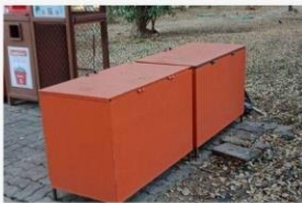
03 31 ม.ค. 65