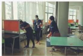
04 19 ต.ค. 64