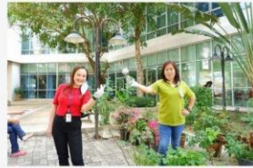
04 ภาพผู้เข้าร่วมกิจกรรม