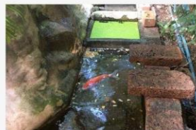
05 ภาพกิจกรรม