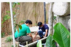
03 ภาพผู้เข้าร่วมกิจกรรม