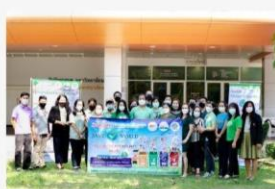
02 ภาพหมู่เพื่อประชาสัมพันธ์เว็บไซต์