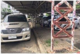
03 ภาพกิจกรรม