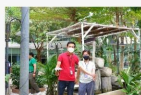
06 ภาพผู้เข้าร่วมกิจกรรม