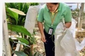
05 ภาพกิจกรรม