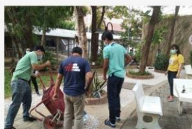
04 โรยหิน ปรับคันหินเตรียม