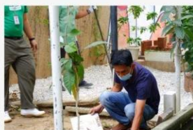
02 ภาพกิจกรรม