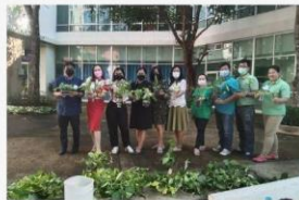
04 ภาพกิจกรรม